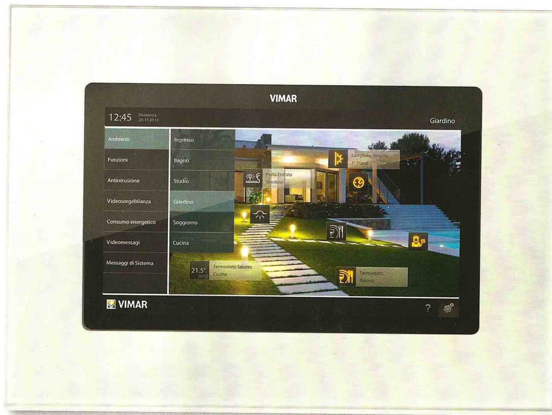
A SINISTRA: il Multimedia Videotouch 10" di Vimar. Permette di controllare tutte le funzioni del sistema domotico By-me di Vimar.