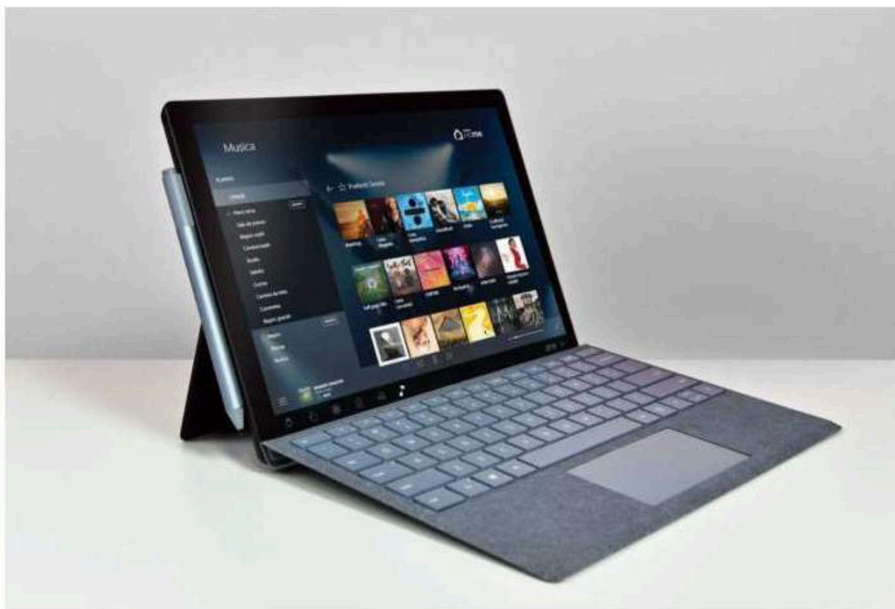
La versione per notebook di HoME mette in evidenza tutti i dispositivi che si possono gestire

Easydome HoMe è di fatto il primo sistema professionale di home automation in grado di far comunicare tutto l'impianto domotico con gli assistenti vocali di Google e Amazon. Basta inserire le credenziali Microsoft usate su Easydom Live e i due assistenti apprenderanno tutte le funzioni dell'impianto, riconosceranno e faranno interagire tutti gli oggetti IoT collegati sulla rete attraverso i comandi vocali. In questo senso, Easydom HoMe integra al suo interno la ricerca automatica dei dispositivi intelligenti che si trovano all'interno dall'abitazione. È come avere un motore di ricerca all'interno della rete domestica in grado di riconoscere i dispositivi compatibili per poter gestire tutto tramite Easydom.